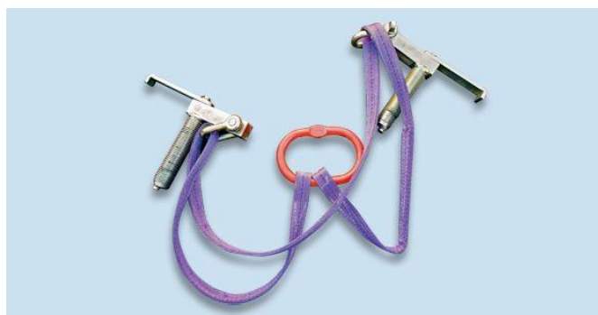
リフティングピン