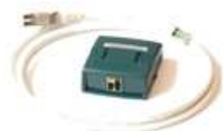
パーマントリンクアダプタ