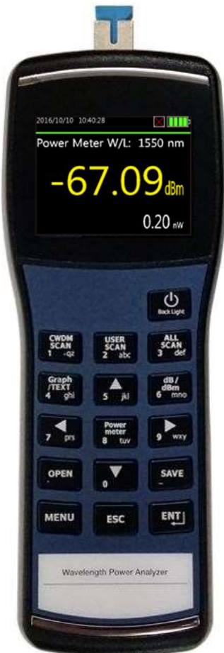
LR4/ER4パワーメータモード(4波長測定)