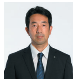
NTTアクセスサービスシステム研究所 所長